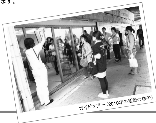
ガイドツアー(2010年の活動の様子)