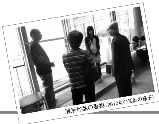
展示作品の看視(2010年の活動の様子)